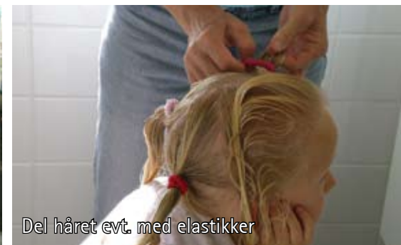
Del håret evt. med elastikker