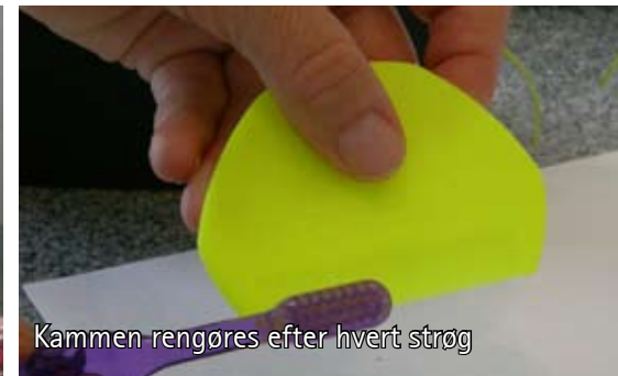
Kammen rengøres efter hvert strøg