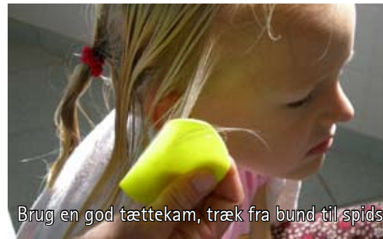
Brug en god tættekam, træk fra bund til spids